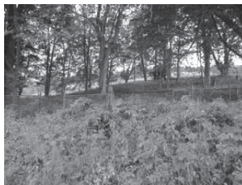
Cerkiew w MBL w Sanoku i miejsce po cerkwi w Ropkach