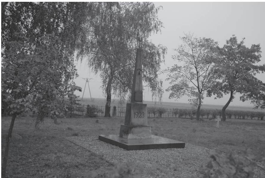
Kalisz-Szczypiorno – obelisk na cmentarzu żołnierzy ukraińskich