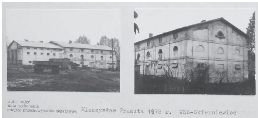
1. fot z karty białej, stan z 1978 r.

Obiekt został rozbudowany, a podziały elewacji zatarte. Wymieniono również dach, zmieniając kąt nachylenia połaci. W bryłach budynków obecnie znajdujących się na miejscu dawnego spichlerza trudno rozpoznać tę należącą do wpisanego do rejestru zabytków obiektu.