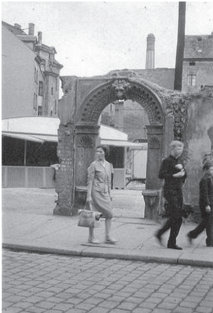
Legnica. Kamienica ul. Panieńska 23/24. Fot. archiwalna, 1966 r.

Ankieta opracowała: Bogna Oszczanowska, 10.05.2010.