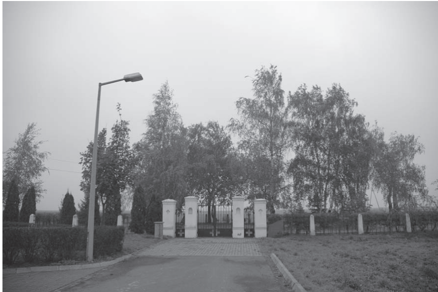
Kalisz-Szczypiorno – widok z parkingu na cmentarz żołnierzy ukraińskich