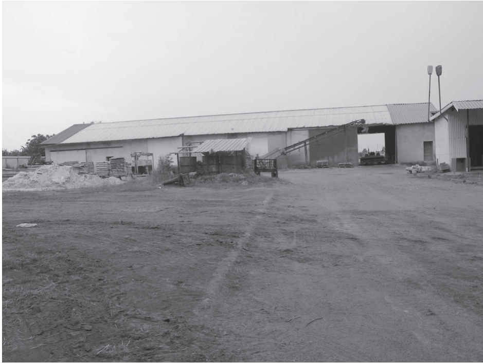
3. Widok spichlerza, wrzesień 2010 r.