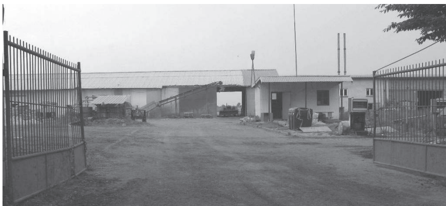
2. Widok spichlerza, wrzesień 2010 r.