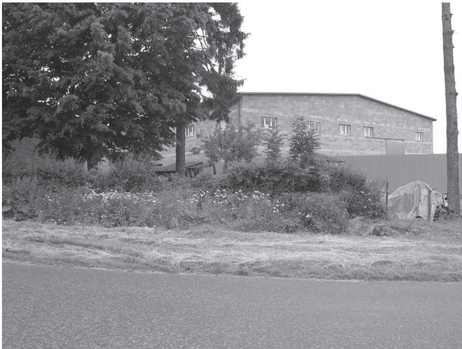
4. Widok ściany szczytowej rozbudowanego spichlerza