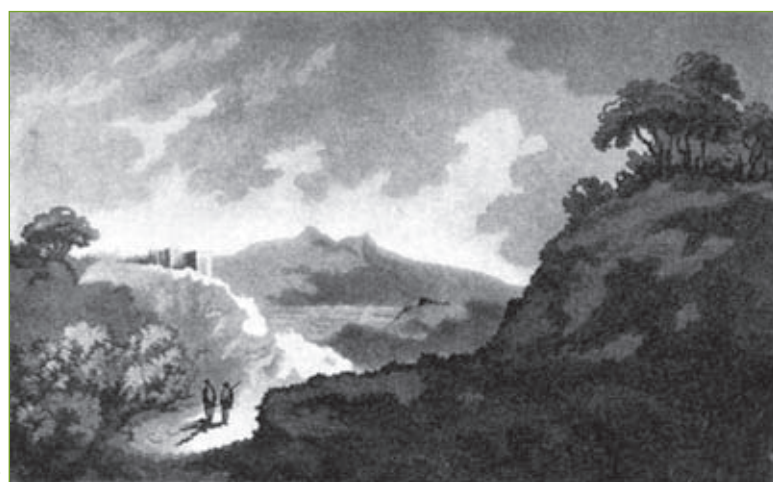
6. W.S. Gilpin (1724-1804), picturesque controversy – banalność natury.