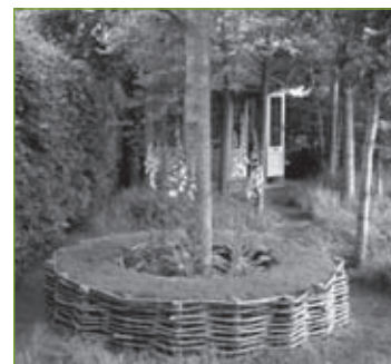
9-10. Ławy darniowe (Prebendal Manor).