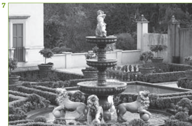
7-8. Fontanna wolno stojąca (ogród włoski w Hamilton) i przyścienna (Villa d'Este).

Zbiorniki naturalne (jeziora, stawy, sadzawki, rzeki, strumyki) często regulowano i starano się dostosować do wymogów kompozycyjnych epoki. Baseny,