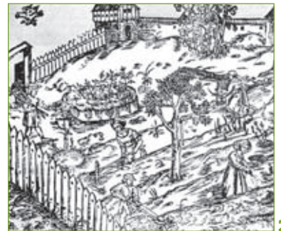
1-2. Ogród zabaw Ogród Edenu , autor nieznan, malowidło ok. 1410, Niemcy, oryginał w Städtisches Kunstinstitut we Frankfurciej i ogród warzywny (rycina, oryginał w: M. Siennik, Herbarz ziół , Kraków (1568).

Zioła, rośliny lecznicze i przyprawowe stosowano zarówno w ogrodach użytkowych (zielniki), jak i ozdobnych (wirydarz, ogrody opackie, hortus conclusus , ogrody zabaw, łąki kwietne). Uprawiane rośliny to: mięta, koper, hyzop, melisa, majeranek, pietruszka, szałwia, tymianek, lawenda, rozmaryn, ruta, konwalia, mietczyk, kminek, malwa, cząber, polej, rzeżucha, boże drzewko, wrotycz, krzew balsamowy, bazylika, kolendra.