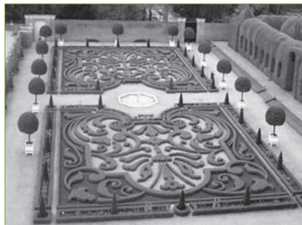
3-4. Parter haftowy oranżeriowy i bindaż ( berso ), ogród Het Loo.

Moda na ogrody barokowe dość szybko rozpowszechniła się w naszym kraju. Podstawą były ogrody włoskie, które rozbudowywano. Zakładano też nowe ogrody przy nowo powstających zamkach i rezydencjach magnackich. Natura – roślinność musiała podporządkować się człowiekowi i jego nowej kreacji. Poszukiwano nowych walorów i efektów plastycznych poprzez organizowanie wewnątrz przestrzennych ogra-