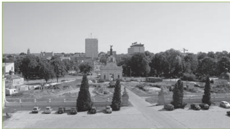
3. Założenie pałacowo-ogrodowe Branickich w Białymstoku. Widok od strony pałacu na dziedzińcu wstępnym, lipiec 2009 r.

W tym miejscu należałoby zaznaczyć, że w ponad 13-letniej historii rewitalizacji Ogrodu Branickich odnotowano stosunkowo niewiele negatywnych gło-