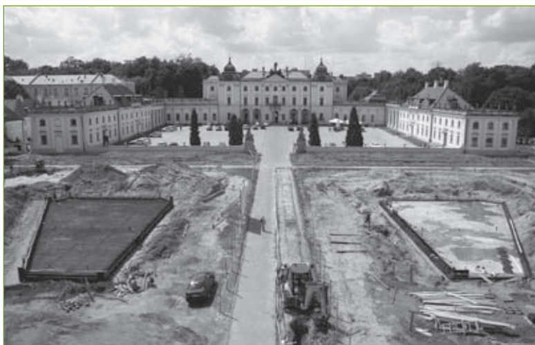
4. Założenie pałacowo-ogrodowe Branickich w Białymstoku. Widok z Bramy Wielkiej pod Gryfem na dziedziniec wstępny, lipiec 2009 r.

dokładał starań, by temat ogrodu, jego historyczne znaczenie i potrzeba rewaloryzacji, nie zniknął na długo z lokalnych mediów. Mimo iż zdawano sobie sprawę, że zamieszczanie informacji w codziennej prasie to działania niewystarczające, to na szerszą promocję nie przeznaczano środków.