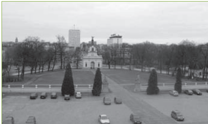
2. Założenie pałacowo-ogrodowe Branickich w Białymstoku. Widok od strony pałacu na dziedziniec wstępny, luty 2008 r.

Równoległe, z niewielkimi przerwami, prowadzono prace pielęgnacyjne zabytkowej zieleni, wydając rocznie od 100 do 200 tys. złotych. W 1998 r. samorząd miejski pozyskał dotację z budżetu Wojewódzkiego Konserwatora Zabytków w Białymstoku w wysokości 15 tys. zł, na rekonstrukcję pierwszego bukszpanowego parteru. Podejmowane w latach następnych próby poszukiwania środków zewnętrznych na rewaloryzację ogrodu, m.in. w fundacjach polsko-amerykańskich, Narodowym Funduszu Ochrony Środowiska i Gospodarki Wodnej czy Ministerstwie Kultury kończyły się niepowodzeniem. W roku 2002 wystąpiła nawet realna groźba zaniechania dotychczasowych działań, a w konsekwencji nawet odstąpienia od realizacji projektu.