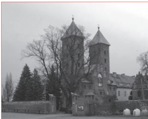
4. Kościół pw. Zwiastowania NMP.