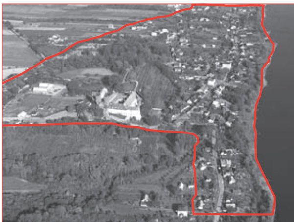
3. Zdjęcie lotnicze z oznaczonym schematycznie zasięgiem wpisu obszaru do rejestru zabytków (wg załącznika graficznego decyzji z 2009 r.). Fot. W. Stępień, 1995 r., zbiory KOBiDZ.

możliwości sióstr, dlatego w 1907 r., już po opuszczeniu klasztoru przez norbertanki, doszło do rozebrania najbardziej zrujnowanego, zachodniego skrzydła klasztoru. Dopiero przejęcie klasztoru przez Zgromadzenie Księży Salezjanów w 1923 r. umożliwiło podjęcie przy nim większych prac remontowych oraz odbudowę. Jednak i tym razem prace te zostały niemal kompletnie unicestwione przez pożar w 1933 r., z którego ocalała kaplica z zachowanym gotyckim wystrojem, sklepienie pomieszczenia i żelbetowe uzupełnienia. Kolejny raz księża odbudowują, remontują i konserwują klasztor. Budynek kościoła szczęśliwie nie doświadczał w tym okresie ani klęski pożaru, ani opuszczenia, dzięki funkcjonującej tam parafii.