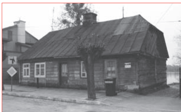
7. Chałupa przy pl. Batorego 1 z końca XIX w. Fot. A. Suchecka, 2010 r.

Można zatem zadać pytanie, czy zasięg ochrony określony w decyzji wpisującej do rejestru zabytków układ urbanistyczny miejscowości jest obecnie właściwy dla konieczności zachowania unikatowych wartości krajobrazu Czerwińska, z ekspozycją najważniejszego z jego elementów, jakim jest zespół klasztorny? I czy nie należy rozważyć potrzeby do-