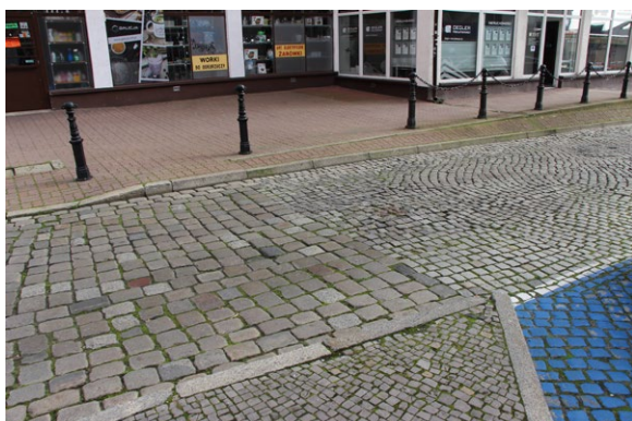
10 Gorzów Wielkopolski. Przykład niewłaściwie przeprowadzonej rewaloryzacji nawierzchni ulic w rejonie staromiejskim, skutkujący zastosowaniem (uzupełnianiem lub ponownym wprowadzeniem) nawierzchni wykonanych z różnego typu historycznej kostki brukowej, układanej w sposób ahistoryczny. Przypadkowe zastosowanie bruku wpływa negatywnie na estetyczny odbiór nawierzchni.