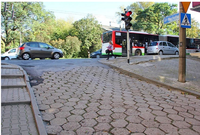
5 Lublin, ul. Pochyła. Nawierzchnia jezdni wykonana z trylinki – zachowana fragmentarycznie, częściowo przykryta asfaltem. Współczesne obustronne nawierzchnie chodników, zmieniony profil ulicy. Nowe nawierzchnie nie współgrają z nawierzchnią historyczną. Fot. J. Niedźwiedź, 2020