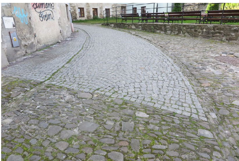
4 Bielsko-Biała, ul. Pankiewicza. Historyczna nawierzchnia ulicy z drobnego kamienia łamanego i otoczków, z rynsztokami z otoczków układanych na sztorc. Na styku z ulicą Krętą zastąpiona współczesną kostką granitową w układzie wachlarzowym. Przykład niewłaściwego doboru materiału. Fot. A. Olczyk, 2020