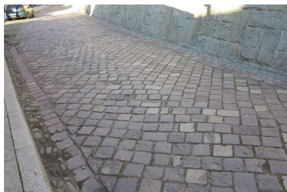
11 Cieszyn, ul. Przykopa. Historyczna nawierzchnia drogi, zasadniczo kompletnie zachowana, wykonana z popularnego w rejonie bruku kostkowego z czerwonego porfiru, opasek z otoczek oraz kostki granitowej. Podczas ostatniego remontu wymieniono uszkodzone elementy, ujednolicono materiał i zniwelowano nierówności, aby poprawić parametry użytkowe.

zapewnienie odwracalności działań związanych z budową lub rewaloryzacją nawierzchni. Umożliwi to odtworzenie jej struktury (warstw podbudowy) i układu nawierzchni w razie konieczności dotarcia do instalacji podziemnych lub naprawy ulicy;