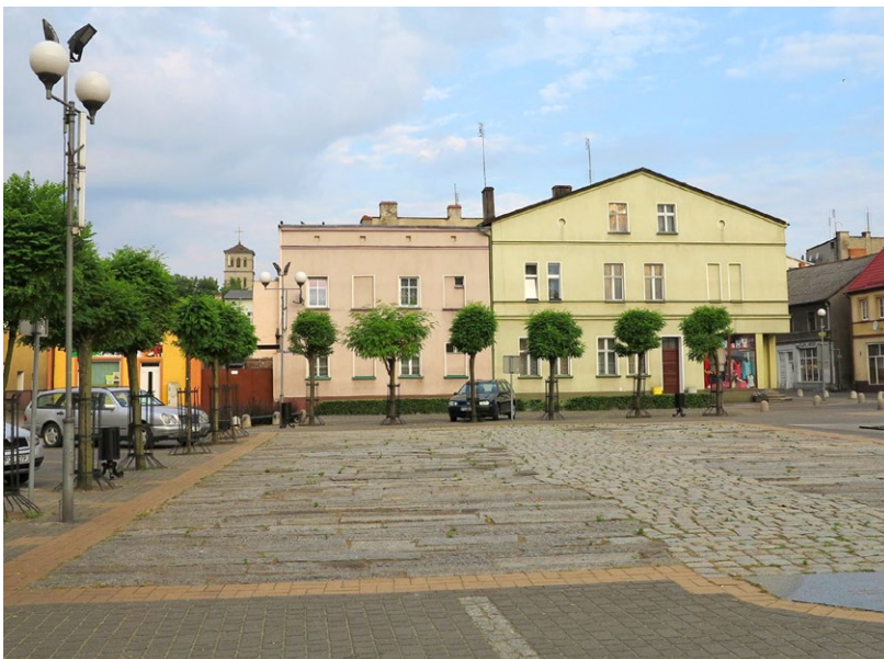
33 Złotów, plac Ignacego Paderewskiego. Drzewa posadzone za gęsto, a zbyt małe misy w nawierzchni uniemożliwiają roślinom prawidłowy rozwój. Fot. R. Banach, 2015