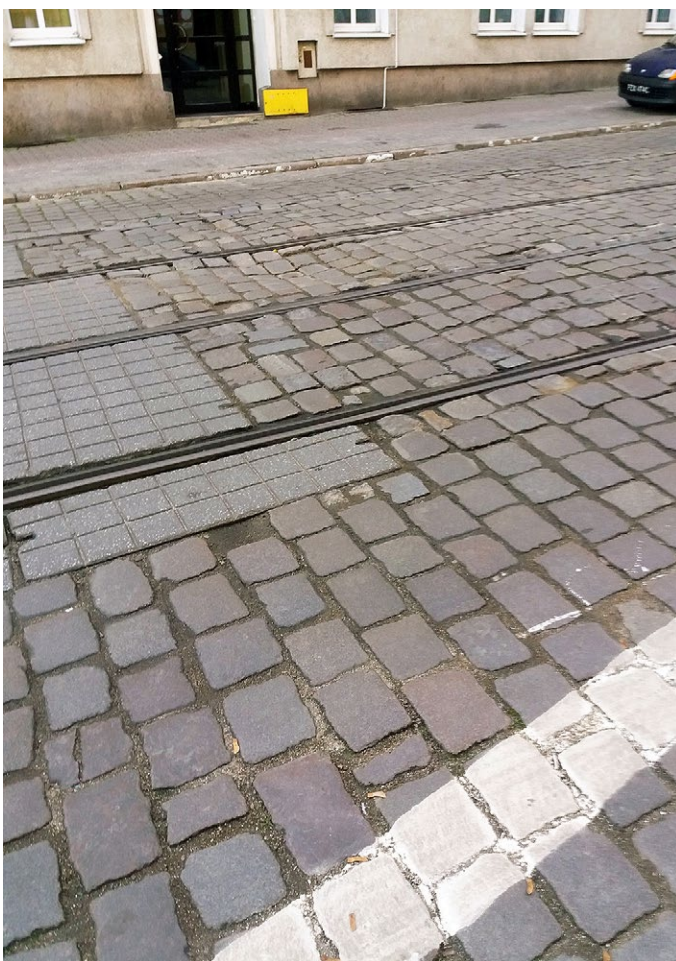
6 Poznań, ul. Mielżyńskiego. Przykład niewłaściwie przeprowadzonego uzupełnienia historycznej nawierzchni ulicy przy użyciu ahistorycznego, nieodpowiedniego materiału. Przypadkowy dobór kostki wpływa negatywnie na estetyczny odbiór nawierzchni. Fot. R. Banach, 2020