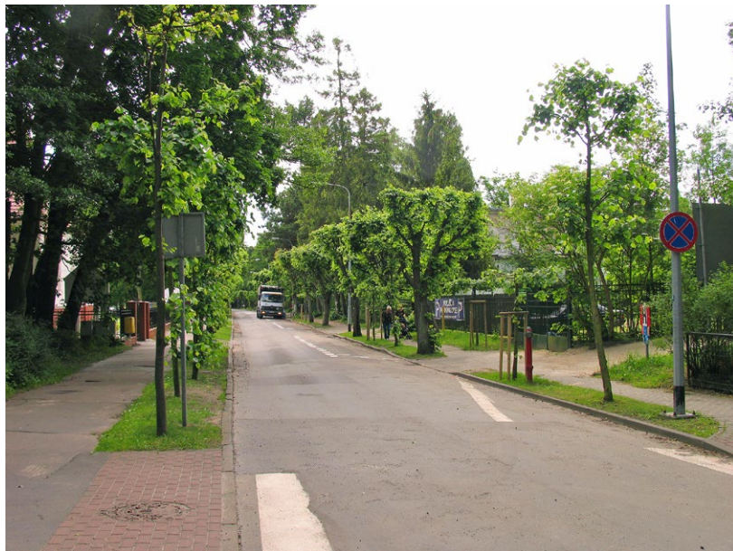
30 Sopot, ul. Powstańców Warszawy. Historyczna aleja z obsadzeniem drzewami o specyficznym formowaniu koronach – uzupełnienia alei nieodpowiednim materiałem roślinnym. Fot. R. Stachańczyk, 2015