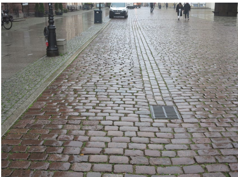
3 Toruń, rynek. Historyczna nawierzchnia rynku wykonana z charakterystycznej czerwonej kostki granitu skandynawskiego, zasadniczo kompletnie zachowana. Podczas ostatniego generalnego remontu głównego historycznego placu w zespole staromiejskim zastosowano metodę przełożenia. Zmieniono wtedy nieznacznie profile placu i usprawniono jego odwodnienie dzięki ściekom powierzchniowym. Fot. R. Kola, 2020