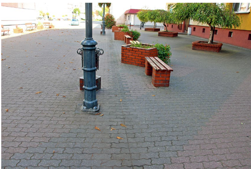
29 Skwierzyna. Chaos stylistyczny i formalny. Wielkość pojemników uniemożliwia prawidłowy wzrost roślinom. Źle dobrany gatunek drzew (forma nie nadaje się do obsadzeń ulicznych); za nisko osadzone korony kolidują z ruchem.