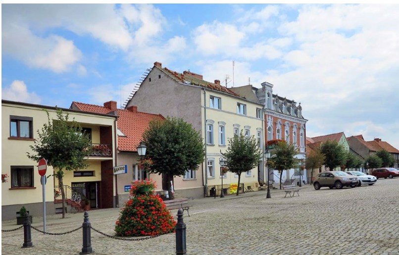
31 Zbąszyń, rynek. Drzewa w chodniku kolidują z ruchem pieszym, pozostawiono zbyt małe misy wokół pni. Fot. R. Banach, 2012