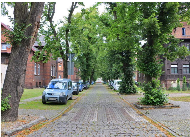
32 Wronki. Zrewitalizowana nawierzchnia jezdni i chodników – drzewa obudowano zbyt wąsko i prawdopodobnie podwyższono poziom gruntu, co stanowi zagrożenie dla starej alei. W trakcie budowy dochodzi do naruszenia systemu korzeniowego, a podwyższenie poziomu gruntu powoduje ograniczenie dostępu tlenu do korzeni. W takiej sytuacji w przysypanej glebie zachodzą procesy chemiczne, wskutek których powstają toksyczne produkty działające na system korzeniowy. Negatywne oddziaływanie na kondycję drzewa jest widoczne w krótkim czasie i może prowadzić do jego zamierania.